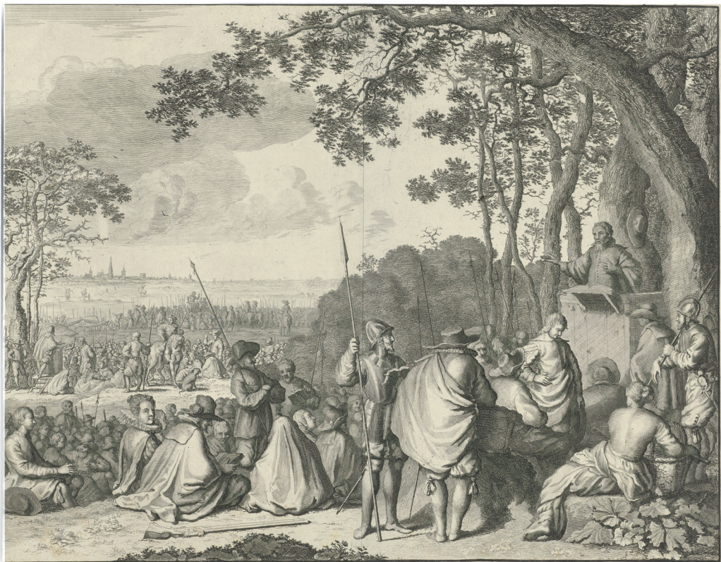
Het is verboden om bij elkaar te komen in kerkgebouwen, daarom ontmoeten aanhangers van het protestantisme elkaar in 1566 buiten. De zogenaamde 'hagenpreken' trekken duizenden mensen. Hagenpreken buiten Antwerpen, Jan Luyken, 1677-1679