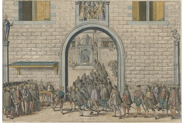
In 1566 bieden aanhangers van het protestantisme een smeek-schrift aan aan de hertogin van Parma. Frans Hogenberg, 1588, Rijksmuseum

Na een opzwepende hagenpreek in het Vlaamse dorp Steenvoorde (tegenwoordig in Frankrijk) op 10 augustus 1566 slaat de vlam in de pan. De protestantse vluchteling Sebas-