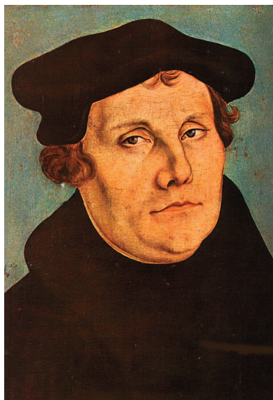
Maarten Luther. Lucas Cranach de Oude, 1529, Lutherhaus Wittenberg

Ondertussen ontstaan binnen het protestantisme verschillende richtingen. Dankzij de