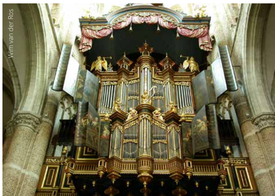
Goes, Grote Kerk (Marcussen, 1970).