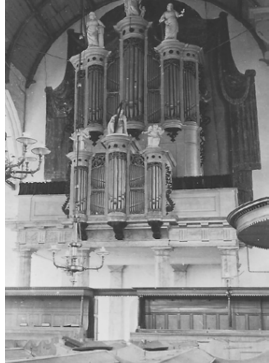
Het voormalige Naber/Quellhorst-orgel in de Grote Kerk te Heusden. In 1944 werd het instrument verwoest toen Duitse soldaten de toren van de kerk opbliezen.