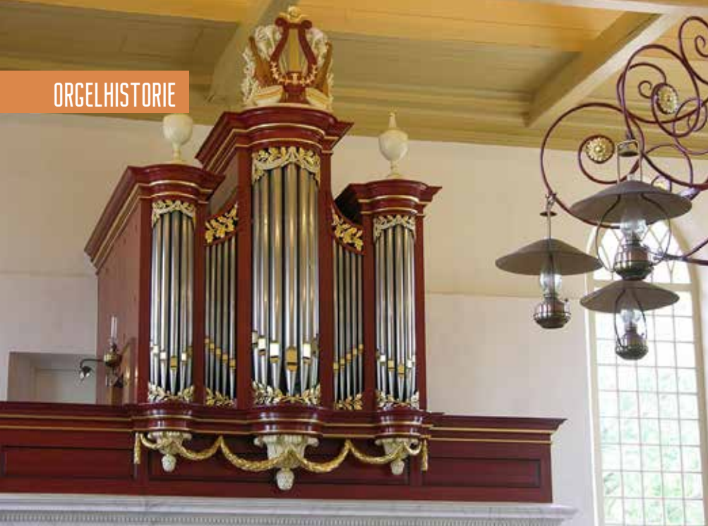
Het De Koff-orgel in de Pieterskerk te Beesd, met de kas van Bätz en Snethlage.