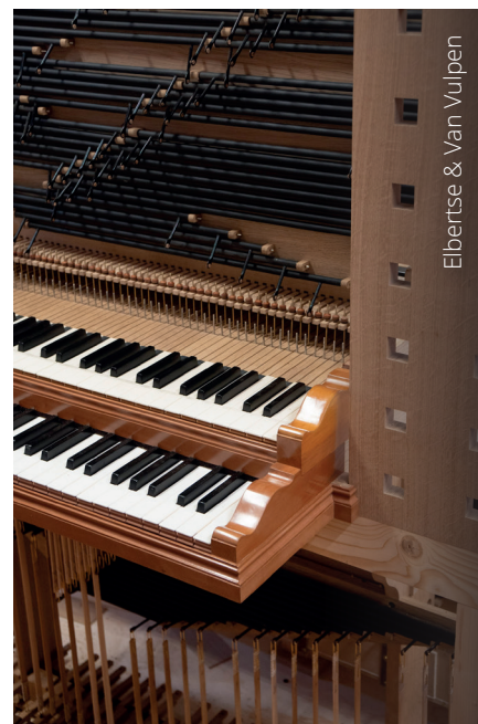
Elbertse & Van Vulpen

In een van de komende nummers besteden we hieraan uitgebreider aandacht.