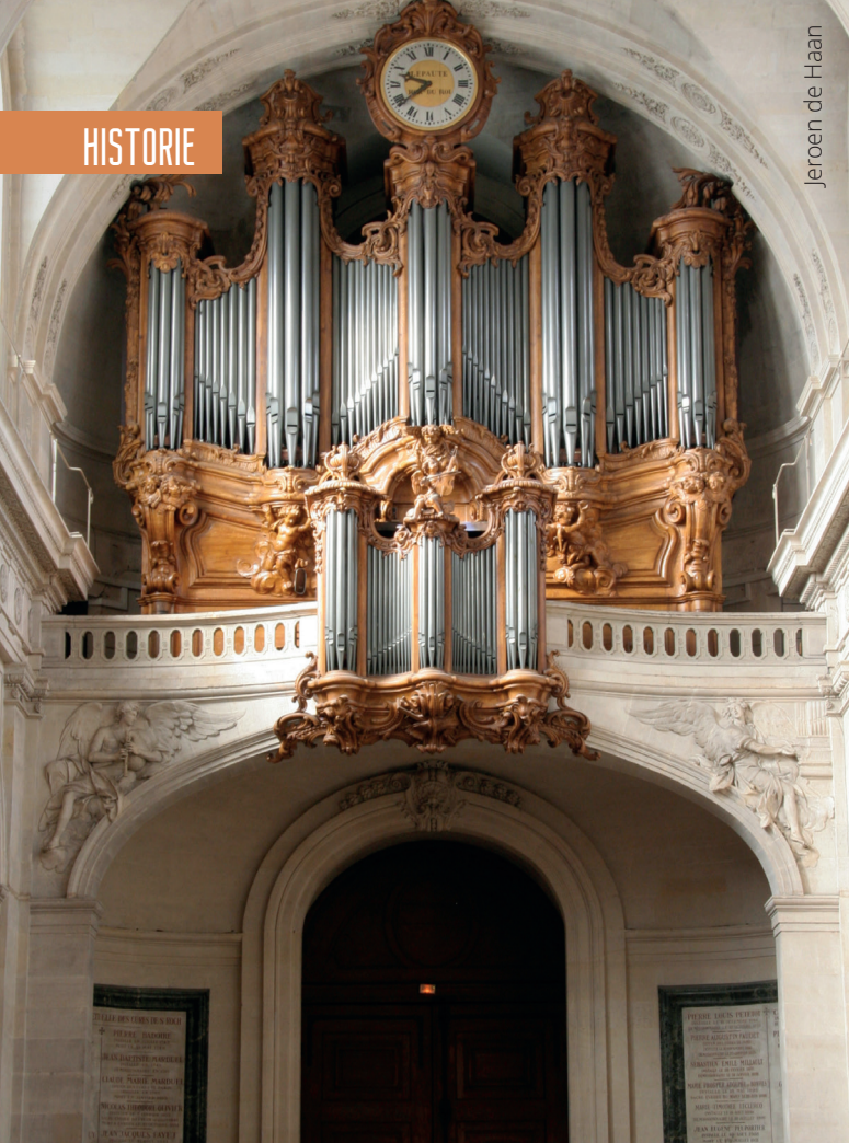
Het L-A. Clicquot-orgel in de Saint-Roch te Parijs.