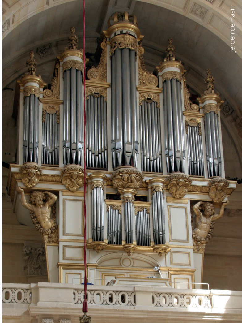
De uit 1687 daterende orgelkas in de Saint-Louis-des-Invalides te Parijs.